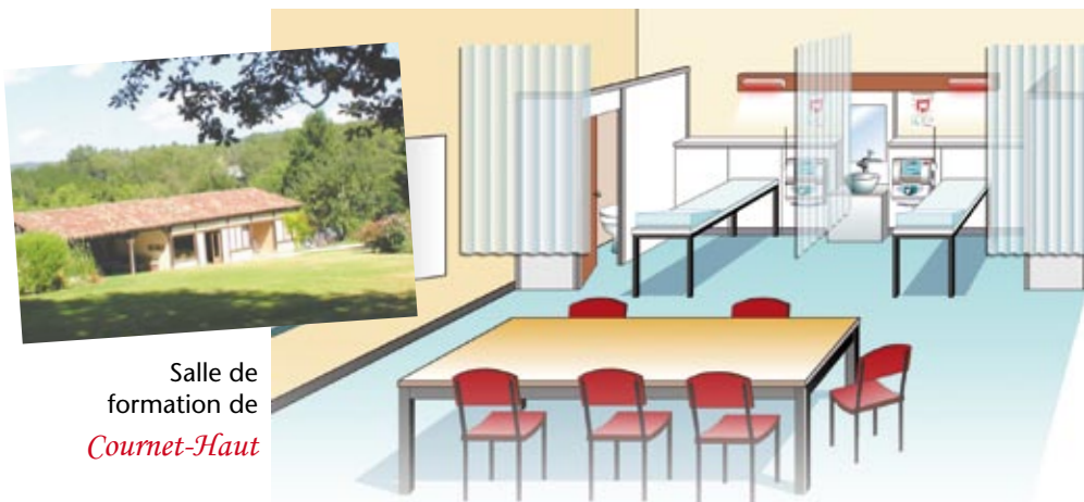
Salle de formation de Cournet-Haut

* pour les non-adhérents, prévoir en sus les frais d'adhésion à Axiomes pour les professionnels, d'un montant de 75 €.