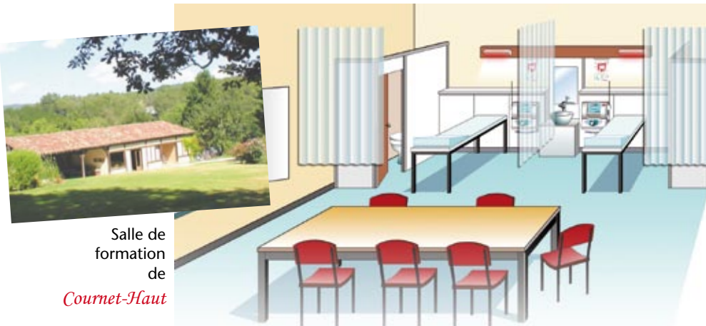
Salle de formation de